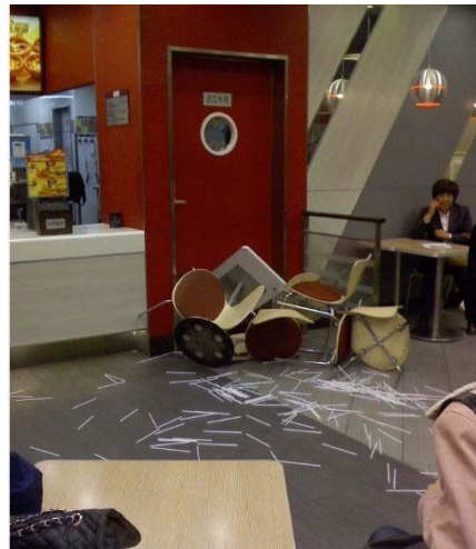
北京一家被砸烂的肯德基店现场

网民愤愤不平：“北京很多肯德基点在晚7:00停止营业，还说优惠卷是假的，排队在我前面的人还能用优惠卷买，到我就成假得了，到了晚上将近11:00还是解决不了，就是不停的请客人喝饮料，这么大的国际企业，做出如此颠倒事实的事情，很令人费解。应该起诉他们欺诈。”