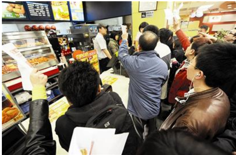
肯德基秒杀门波及全国 多家门店发生冲突

肯德基“超值星期二秒杀”活动此次在全国推出，上海、南京、成都等地大量发生类似事件，多位读者向媒体报称：说下载的肯德基全家桶半价优惠券不能用，已有多人与肯德基方发生争执。在杭州文一路翠苑电影大世界的肯德基餐厅，有七八个人在店里安静地坐着抗议，也不用餐，手里拿着优惠券，说，写得明明白白，怎么不可以用？（据杭州《都市快报》）